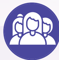
Menywod a grwpiau ar sail rhywedd