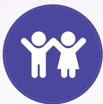
Plant (o dan 18)

Elwodd sawl math o bobl a grwpiau o ymchwil o Gymru