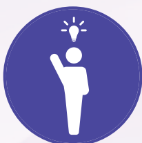
Gweithwyr proffesiynol yn y diwydiannau creadigol