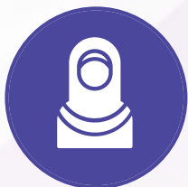
Cymunedau lleiafrifol ac ar y cyrion