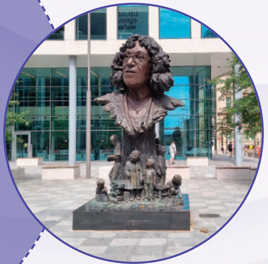
Cerflun Betty Campbell yng Nghaerdydd

Taniodd ymchwil i “Wneud Merched Lleiafrifoedd Ethnig yn Weladwy” ddadl gyhoeddus ar y diffyg cofebion wedi'u cysegru i fenywod Cymru. Arweiniodd hyn yn ei dro at greu cerfluniau i'r brifathrawes ysbrydoledig Betty Campbell yng Nghaerdydd yn 2021. Dilynwyd hyn gan gerflun yr awdures Elaine Morgan yn Aberpennar ym mis Mawrth 2022 ac yn fwy diweddar, anrhydeddwyd y bardd, ymgyrchydd a'r morwr arloesol, Cranogwen, â cherflun yn Llangrannog ym mis Mehefin 2023. Dyma un enghraifft o sut y gall ymchwil gael effeithiau diriaethol sy'n ymestyn y tu hwnt i'r byd academiaidd, gan adael etifeddiaeth barhaus o newid cadarnhaol am genedlaethau i ddod.